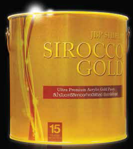
#SG-100 ขนาดบรรจู 1 แกลลอน , 1/4 แกลลอน , 1 ปอนด์

พลิตจากอะครีลิคเรซิ่นแท้ 100% พลม พงมุกทองพิเศษจากยุโรป ให้สีทองสุกโดดเด่น ดังกองคำแก้ปิดบังพื้นพิวดีเยี่ยม ใช้งานได้ อเนกประสงค์ทุกพื้นพิว เหมาะลำหรับ พื้นพิวทุกชนิด แช่น ปูน อิฐ กระเบื้อง คอนกรีต เซรามิค กระจก ไม้ และโลหะทุกชนิด ใช้ทางาน ลายรดน้ำ ศาลพระภูมิ พระพุทธรูป โบลก์ เจดีย์ เช่อฟ้า ใบระกา ประตูอัลลอยด์ และเฟอร์นิเจอร์ ฯ นอกจากนี้ยังสามารถ ทาทับบนสีน้ำมันแห้งช้าได้โดยไม่ทำให้ สีเดิมลอกล่อน